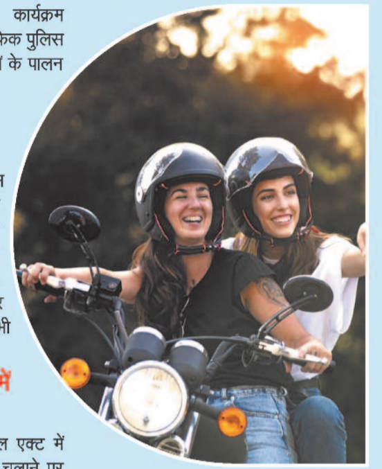
कई नैर-सरकारी संगठन और निजी कंपनियां कॉर्पोरेट स्नामाजिक उत्तरदायित्व (CSR) के तहत मुफ्त हेलमेट वितरण, जागरूकता रैली और सड़क सुरक्षा कार्यशालाएं आयोजित कर रही हैं।

कॉर्पोरेट स्नामाजिक उत्तरदायित्व (CSR) के तहत मुफ्त हेलमेट वितरण, जागरूकता रैली और सड़क सुरक्षा कार्यशालाएं आयोजित कर रही हैं।