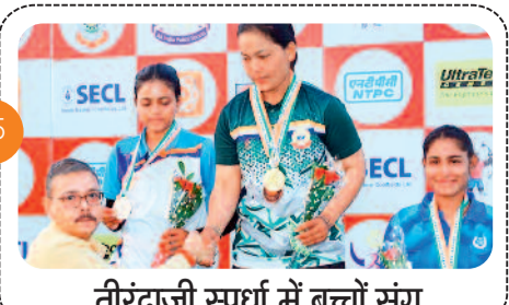
तिरंदाजी स्पर्धा में बच्चों संग..